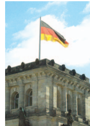
Die Stimme der IG BCE hat Gewicht – bei den Landesregierungen und auch in Berlin.

Unsere Solidarität endet nicht an den Grenzen Europas. Die IG BCE beteiligt sich an internationalen Solidaritätsaktionen und nutzt die Möglichkeiten zur internationalen Zusammenarbeit mit Gewerkschaften und Organisationen, unter anderem in den USA, Lateinamerika, Japan, Vietnam und China.