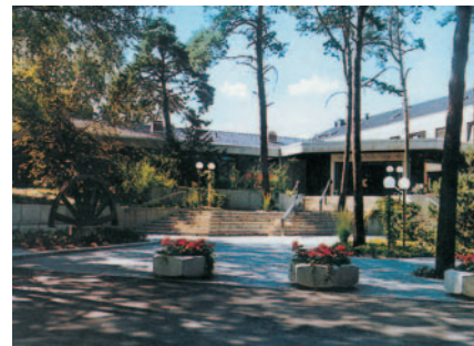
in Haltern am See