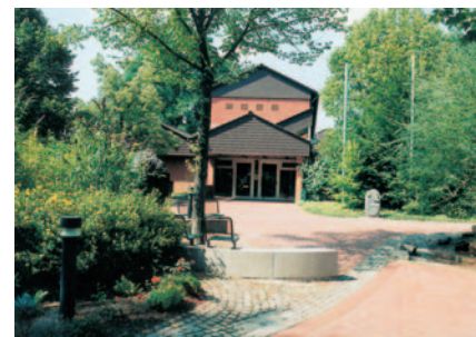
in Bad Münder am Deister